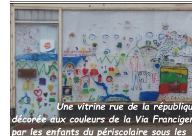
Une vitrine rue de la république décorée aux couleurs de la Via Francigena par les enfants du périscolaire sous les conseils de Jannina.