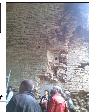
1 ères visites de la tour Charles Quint