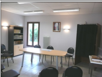
La nouvelle salle de mairie

Ils commenceront à la mi-juin pour se terminer en principe mi-septembre. Nous sommes conscients des désagréments que causeront ces travaux en pleine saison d'été, le calendrier initialement imaginé n'ayant pu être tenu.