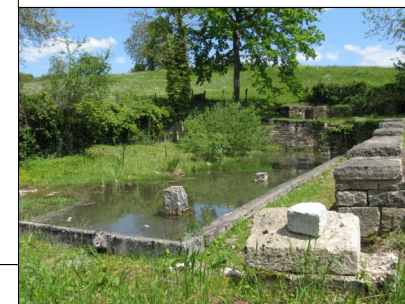
Le lavoir du Magny