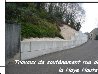
Travaux de soutènement rue de la Haye Haute.

Lumières de Noël : elles brilleront à partir du marché de Noël. Chaque commune associée animera son centre bourg autour du traditionnel sapin.