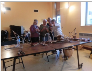
L'atelier "vannerie" le 28 nov

* après-midi récréatif à partir de 14 heures 30 avec projection d'un dessin animé suivi d'un goûter puis de la visite du père Noël pour la distribution de chocolats au profit des enfants du village et des enfants des adhérents de l'association "les Amis de Frettes".